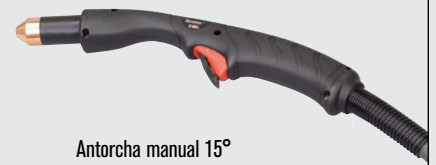
Antorcha manual 15°