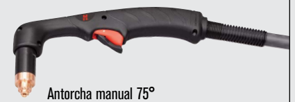
Antorcha manual 75°

(visitar www.hypertherm.com para más opciones de antorchas)