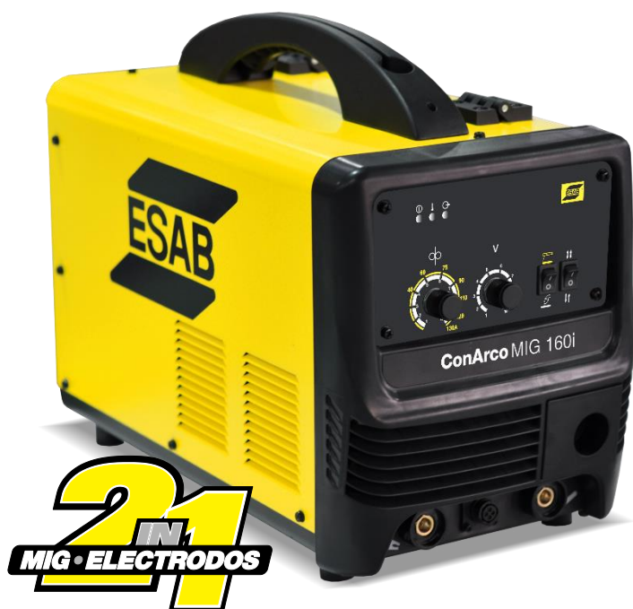
ConArco Mig 160i