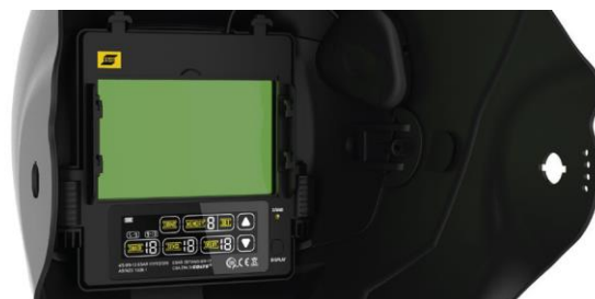
Óptica ADF de Alta clase, con interfaz de pantalla táctil en color.