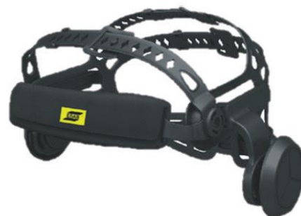
Halo Cómodo arnés de 5 regulaciones (vista frontal).