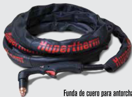
Funda de cuero para antorcha