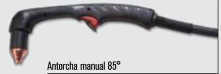
Antorcha manual 85°

(para ver más opciones de antorchas, visite www.hypertherm.com )