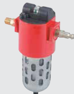
Juego de filtración de aire