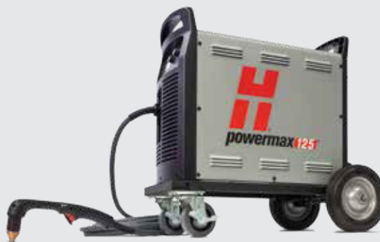
Juego de ruedas