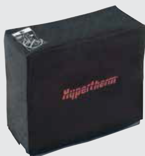
Cubierta contra el polvo para el sistema