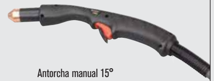
Antorcha manual 15°